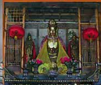
La boîte des disciples